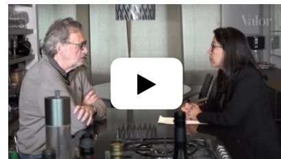
A hora e a vez dos vinhos portugueses 07/06/2017

vem acontecendo, é fortalecer as instituições de controle, como Ministério Público, Receita Federal, os órgãos voltados para a transparência. Fortalecer o que se pode chamar de "sistema de integridade". Somos ingênuos ao pensar que votaremos apenas em pessoas capacitadas. Não - vamos votar nas pessoas que os partidos nos oferecem, e elas podem não ser grande coisa. A