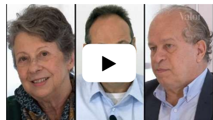
A chance e o risco de Temer 20/05/2016

Para concluir, a questão-chave é a seguinte: se os valores dos pais não podem, em hipótese alguma, ser colocados em questão pelos professores e