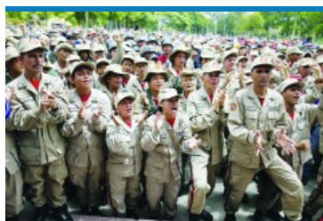
Membros de milícia chavista antes de exercícos militares ordenados por Maduro em resposta à ameaça militar dos EUA