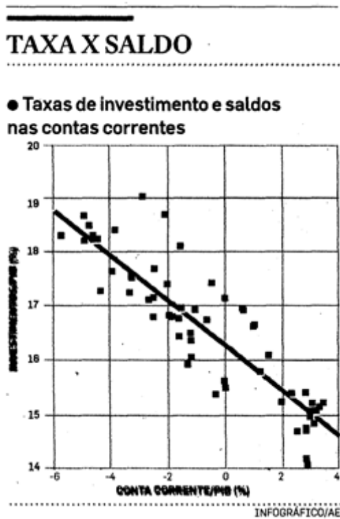
Gráfico de Pastore

déficit em conta corrente e de taxa de câmbio apreciada que se estimulará a poupança privada. Quanto à poupança pública, não basta reduzir a despesa corrente; é necessário, adicionalmente, nos termos da Reforma Gerencial de 1995, tornar mais eficientes os serviços sociais e científicos do Estado.